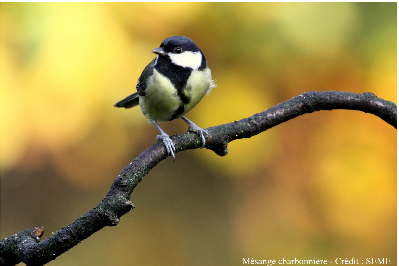
Mésange charbonnière